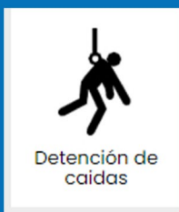
Detención de caídas